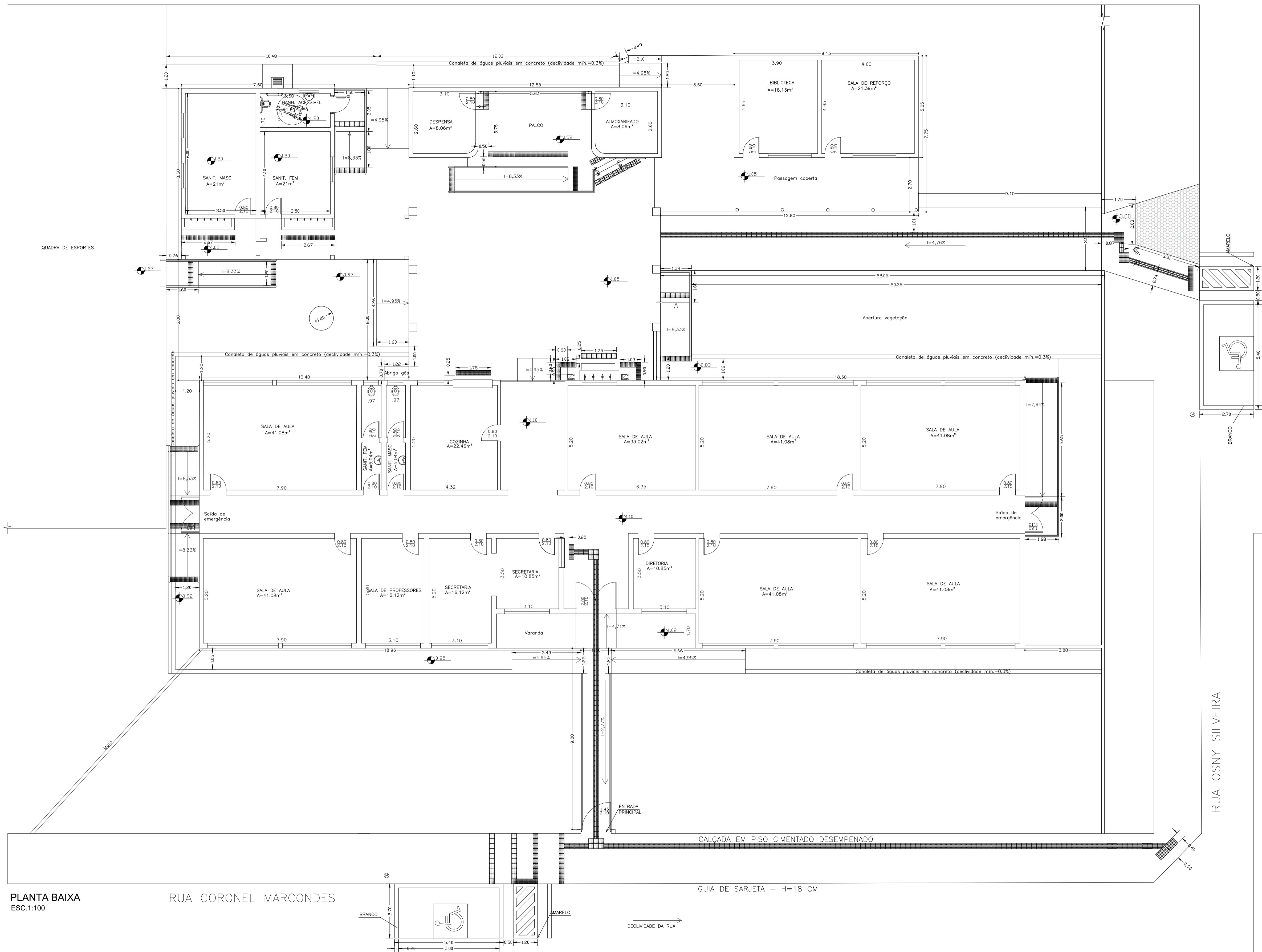
PLANTA BAIXA ESC. 1:100