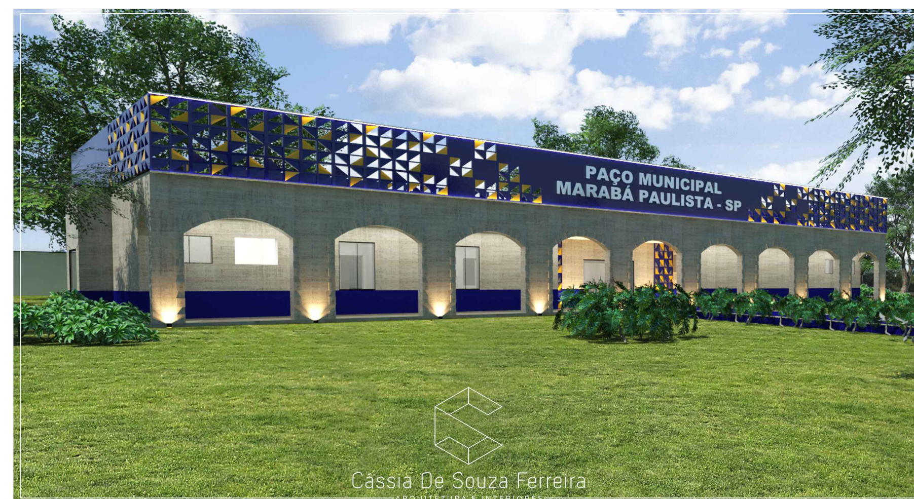
3D PERSPECTIVA PREFEITURA MUNICIPAL MARABÁ PAULISTA esc. 1/200