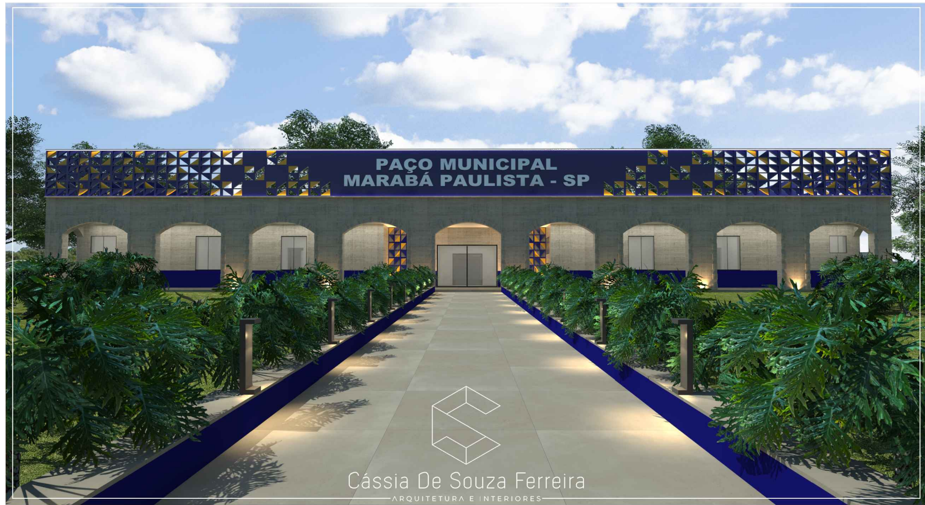
3D PERSPECTIVA PREFEITURA MUNICIPAL MARABÁ PAULISTA esc. 1/200

NOTAS: - CONFERIR MEDIDAS EM OBRA. - TODAS AS COTAS ESTÃO EM METROS. - AS COTAS PREVALECEM SOBRE O DESENHO. - INFORMAÇÕES SUJEITAS A REVISÕES E ALTERAÇÕES. - AS COTAS REFEREM-SE AS MEDIDAS ACABADAS, SALVO QUANDO INDICADO O CONTRÁRIO.