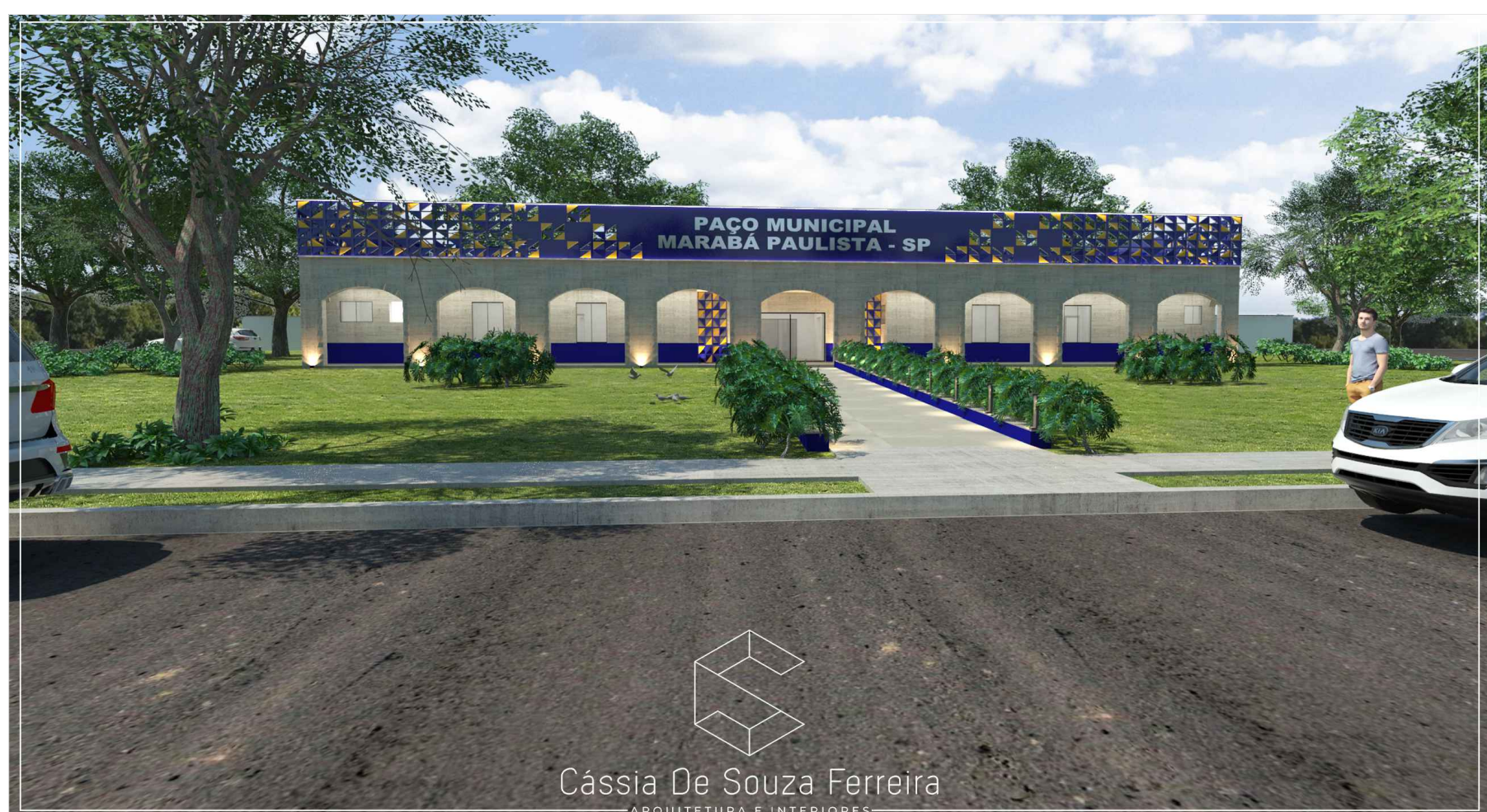
3D PERSPECTIVA PREFEITURA MUNICIPAL MARABÁ PAULISTA esc. 1/200

IMP IMPLANTAÇÃO PREFEITURA MUNICIPAL MARABÁ PAULISTA esc. 1/200